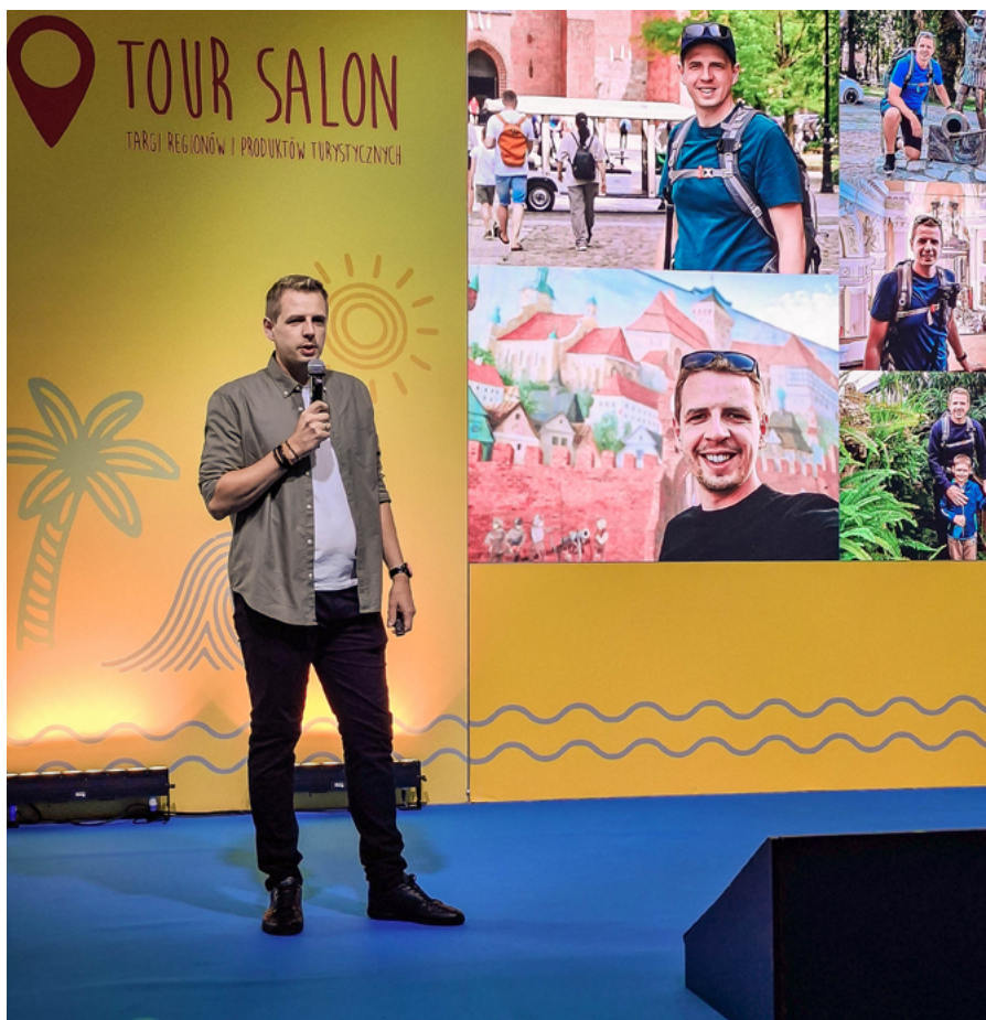
AUTOR PRZEWODNIKA WYGŁASZAJĄCY PRELEKCJĘ PODCZAS TARGÓW TOUR SALON 2025